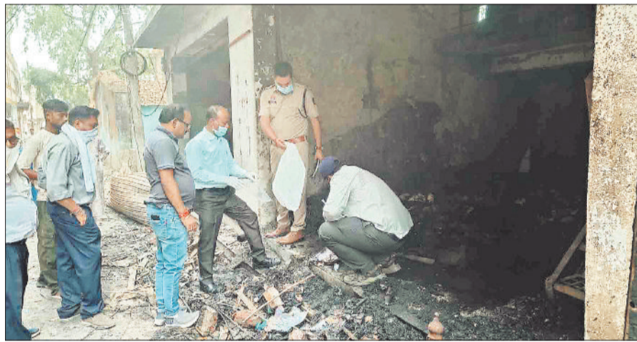
जांच करती फॉरेंसिक टीम।

शहर के हृदयस्थल रममंदिर मार्ग स्थित घनी आबादी में संचालित मुकेश प्लास्टिक एवं पटाखा दुकान में 23 अप्रैल को दोपहर में भीषण आग लग गई थी। आग ने देखते ही देखते विकराल रूप धारण कर लिया था। आग की लपटें एवं काले धुएँ का गुबार 10 किमी दूर तक दिखाई दे रहा था। इस दौरान पटाखा गोदाम में आग भड़कने के कारण घंटों तक तेज धमाके होते रहे। आग आसपास के आधा दर्जन घरों एवं दुकानों में भी फैल गई थी जिससे लोगों को भारी आर्थिक क्षति पहुंची है। मामले की