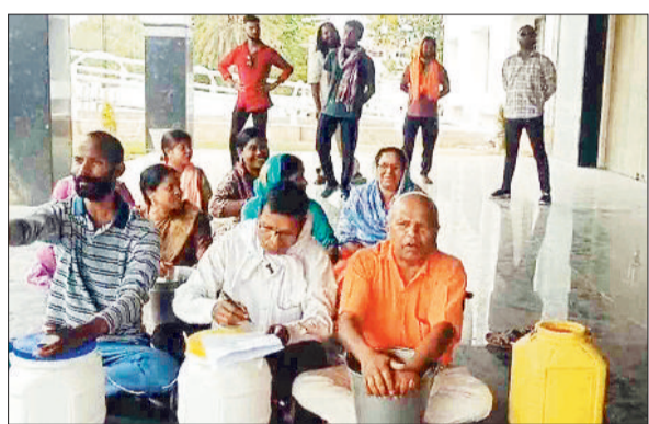
प्रदर्शन करते लोग।

प्रदर्शनकारियों ने एक सप्ताह में स्थिति नहीं सुधरने पर उग्र आंदोलन की चेतावनी दी है। बता दें